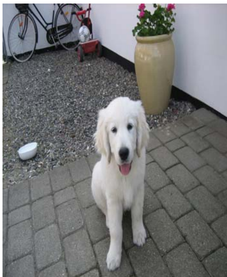
Mig som lille

Skrevet af Kalle med en smule hjælp af far.