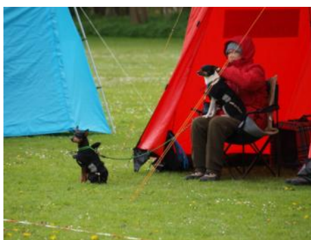
Man kan også bare nyde vejret