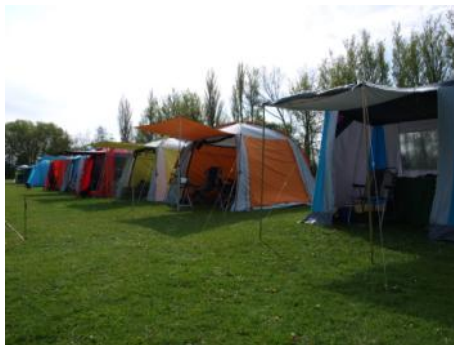
Landsbyen er tom