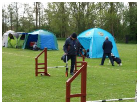
Banen måles op