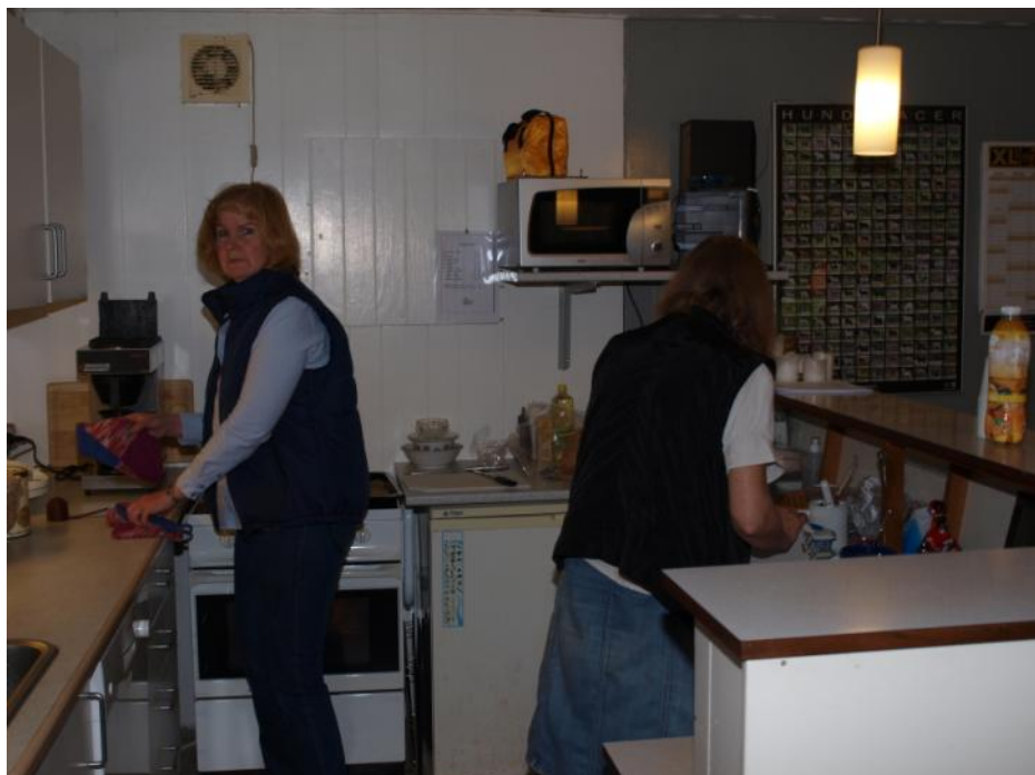
Tak til det altid hjælpsomme køkkenpersonale